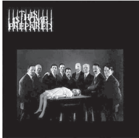
Picture 4 Victim of Misogyny