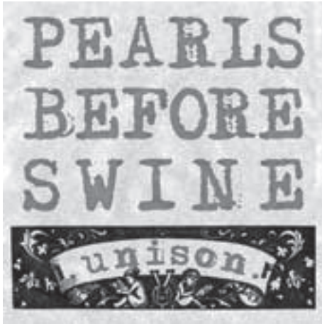
Picture 3 Don't Drop Pearls in front of Pigs