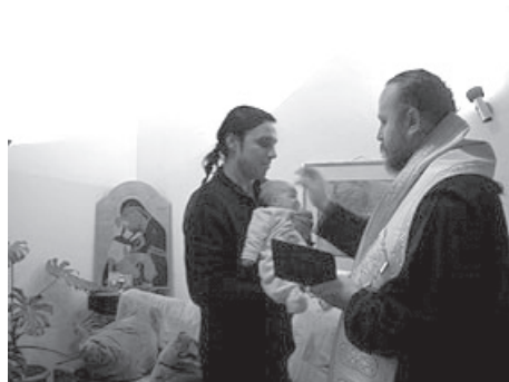
Picture 2 Musician as a Godfather