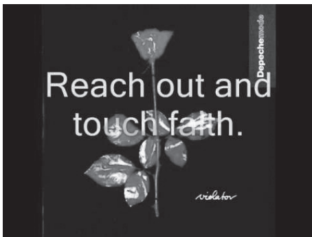
Picture 5 Reach out and touch faith